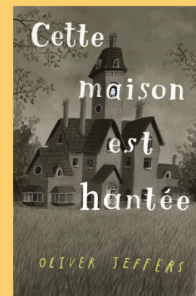
Cette maison est hantée Oliver Jeffers Ed. Kaleidoscope 2022, 18€