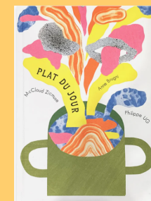
Plat du jour Philippe UG Ed. Des grandes personnes 2019, 22€