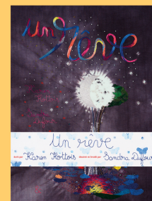
Un rêve Karen Hottois, Sandra Dufour Ed. Esperluette 2022, 22€