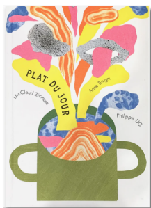
Plat du jour Philippe UG Ed. Des grandes personnes 2019, 22€