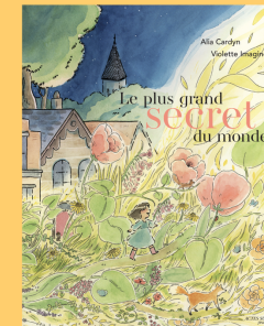
Le plus grand secret du monde Alia Cardyn, Violette Imagine Ed. Actes Sud Jeunesse 2023, 16,80€