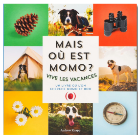
Mais où est Momo ? Vive les vacances Andrew Knapp Ed. Des grandes personnes 2021, 13,50€